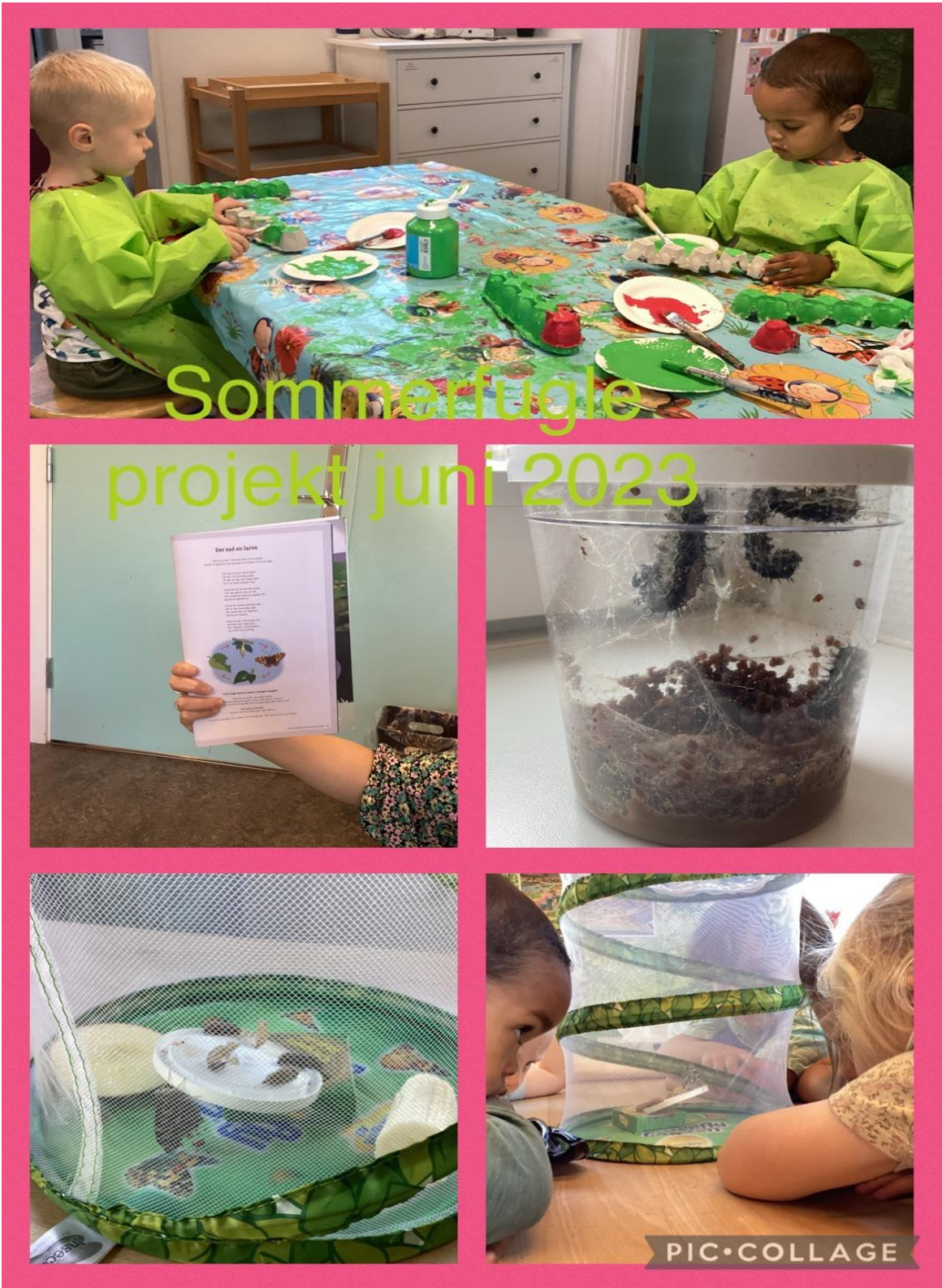
Foto fra naturprojekt hvor vi arbejdede med sommerfuglelarver fra puppe til sommerfugl.